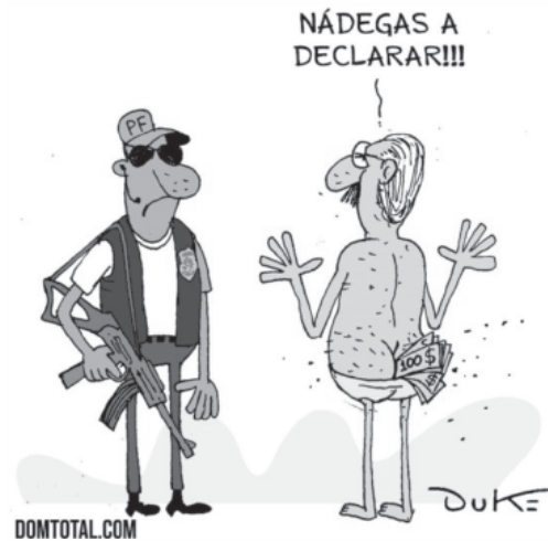
(Duke. Senador flagrado com dinheiro na cueca. Domtotal.com. 15 out. 2020. Disponível em: https://domtotal.com/charge/3086/2020/10/senador-flagrado-com-dinheiro-na-cueca/ . Acesso em: 19 out. 2020.)

Leia o texto Senador flagrado com dinheiro na cueca , de Duke: